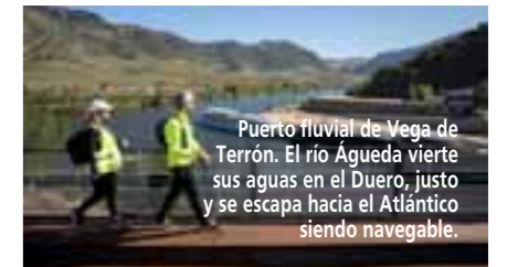
Puerto fluvial de Vega de Terrón. El río Águeda vierte sus aguas en el Duero, justo y se escapa hacia el Atlántico siendo navegable.