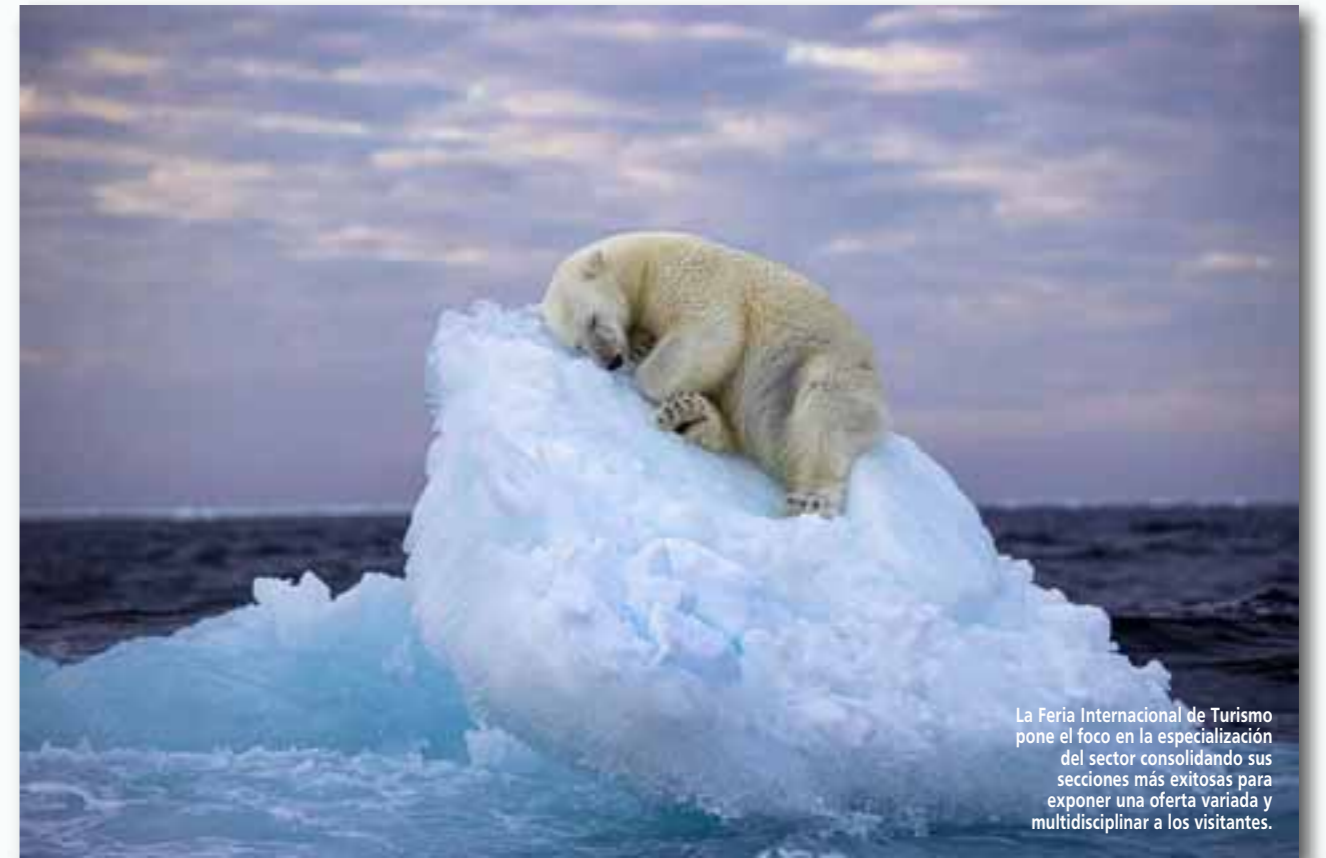
La Feria Internacional de Turismo pone el foco en la especialización del sector consolidando sus secciones más exitosas para exponer una oferta variada y multidisciplinar a los visitantes.

En el caso de los alojamientos, el tanto por ciento de jubilados españoles aumenta considerablemente respecto a las parcelas, acumulando más de la mitad de las reser-