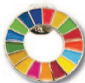
Insignia de los ODS