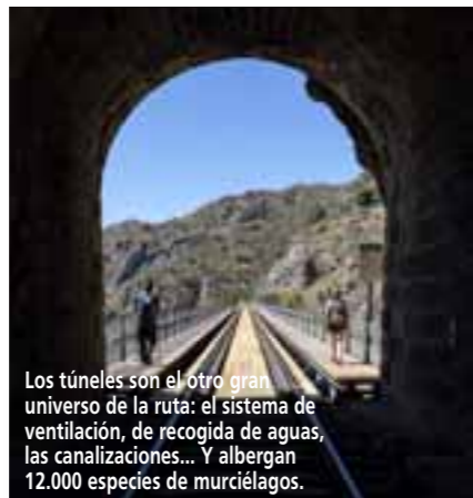
Los túneles son el otro gran universo de la ruta: el sistema de ventilación, de recogida de aguas, las canalizaciones... Y albergan 12.000 especies de murciélagos.

ye el paso por diez vertiginosos puentes que imitan el estilo en hierro de la escuela francesa de Eiffel y que, en tierras salmantinas, se encuentran suspendidos