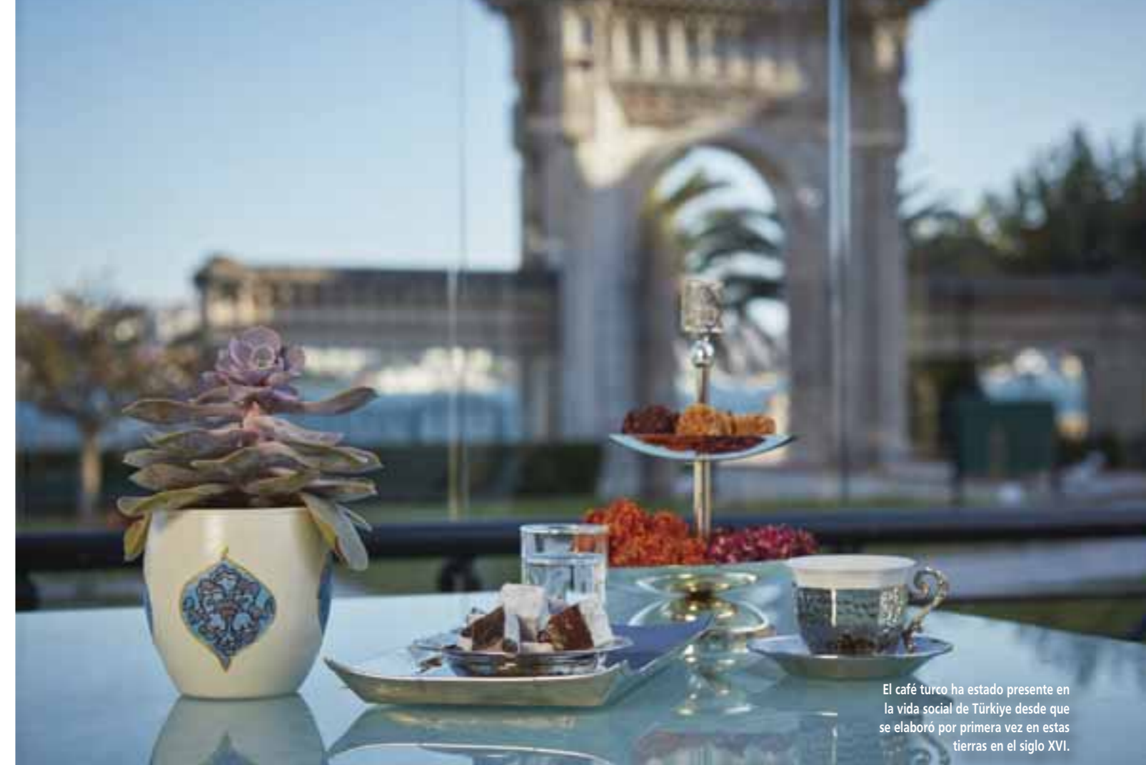
El café turco ha estado presente en la vida social de Türkiye desde que se elaboró por primera vez en estas tierras en el siglo XVI.

En Türkiye es habitual que las visitas a amigos o familiares se acompañen con un café y está igual de presente en bodas, ceremonias, reuniones y nacimientos. Como curiosidad, la palabra empleada para referirse al desayuno es kahvaltı, traducido literalmente como "antes del café" y el abanico de posibilidades es tan amplio que siempre le