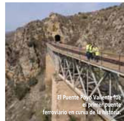
El Puente Poyo Valiente fue el primer puente ferroviario en curva de la historia.

za que los rodea. El rugido del agua abajo y el viento que sopla entre los cañones añaden una atmósfera de misterio y grandeza. A lo largo del camino, los vestigios de la historia ferroviaria se entrelazan con la belleza natural del entorno. Estaciones abandonadas y antiguas locomotoras en desuso recuerdan tiempos pasados, cuando este camino era una arteria vital para la comunicación y el transporte en la región. Detenerse en estos puntos y reflexionar sobre el pasado industrial de la zona, mientras se maravillan con la