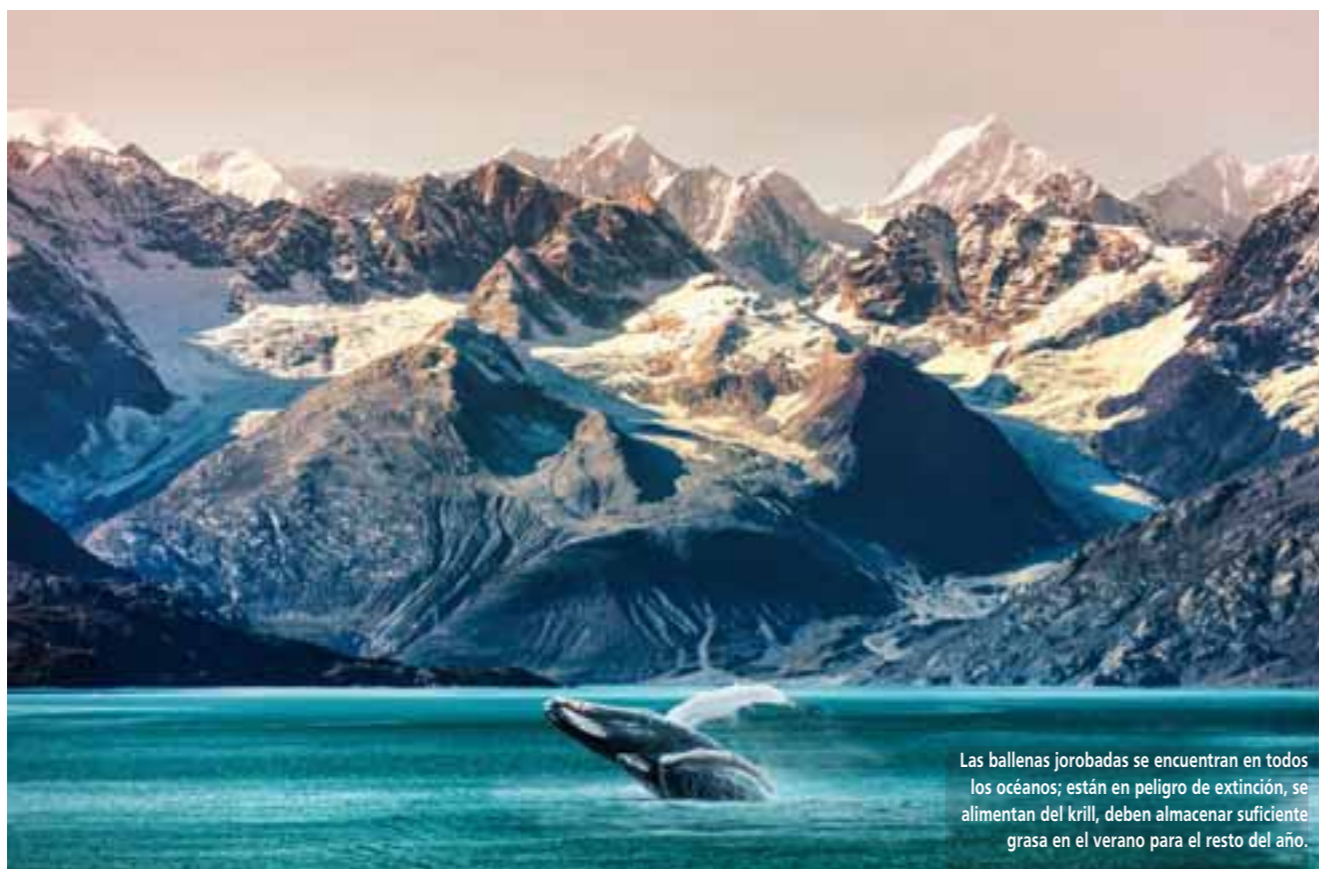
Las ballenas jorobadas se encuentran en todos los océanos; están en peligro de extinción, se alimentan del krill, deben almacenar suficiente grasa en el verano para el resto del año.