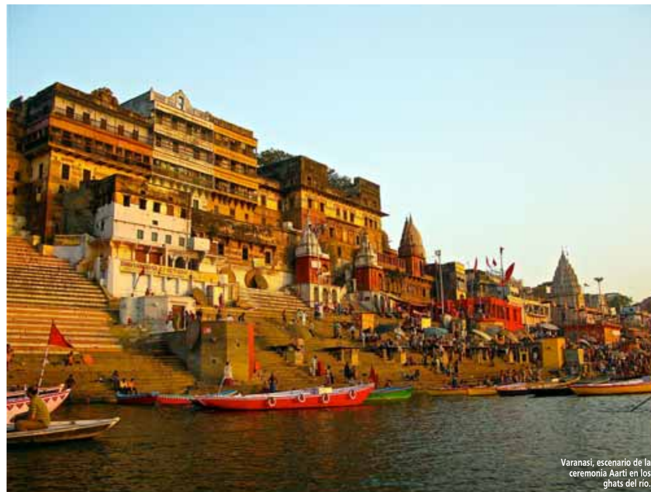
Varanasi, escenario de la ceremonia Aarti en los ghats del río.