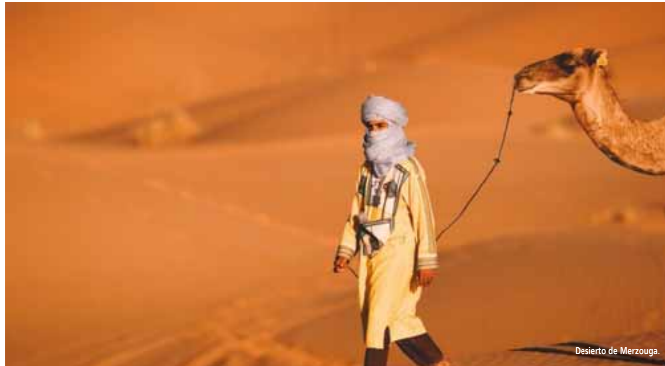
Desierto de Merzouga.

chito de laurel o el "bolo do caco", un tipo de pan elaborado con harina de trigo que se come preferentemente con mantequilla de ajo. Especial mención merece la Zona Vieja de Funchal, que constituye también una gran atracción de la vida nocturna madeirense con sus bares con música ambiente, donde se sirve la tradicional poncha, o restaurantes para degustar las delicias culinarias de Madeira, como el filete de pez espada o la brocheta de carne de res sazonada con ajo, sal y laurel.