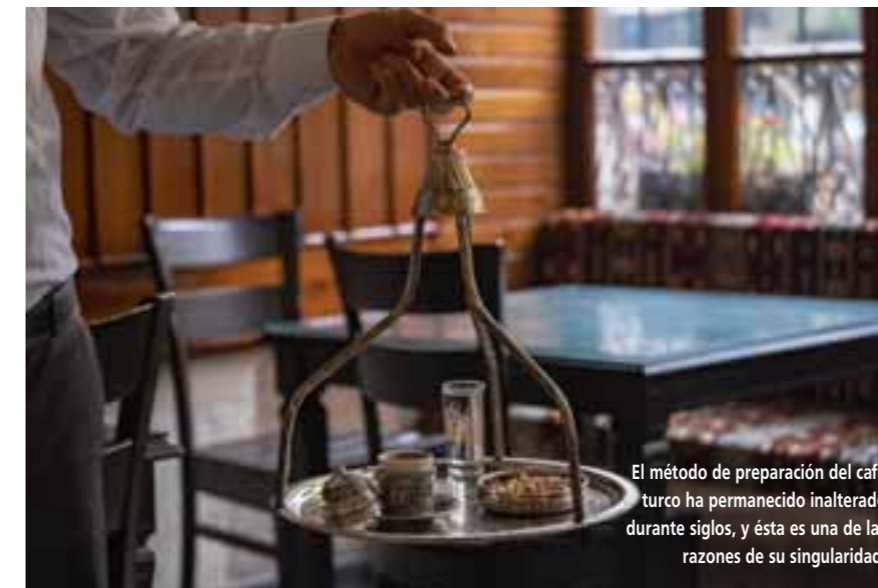
El método de preparación del café turco ha permanecido inalterado durante siglos, y ésta es una de las razones de su singularidad.

de hervirlo hasta convertirlo en espuma, se sirve en taza de café en la que se forma una capa espumosa en la parte superior. A diferencia de otros cafés, se vierte en la taza con sus posos y siempre acompañado de un vaso de agua, delicias turcas u otros dulces.