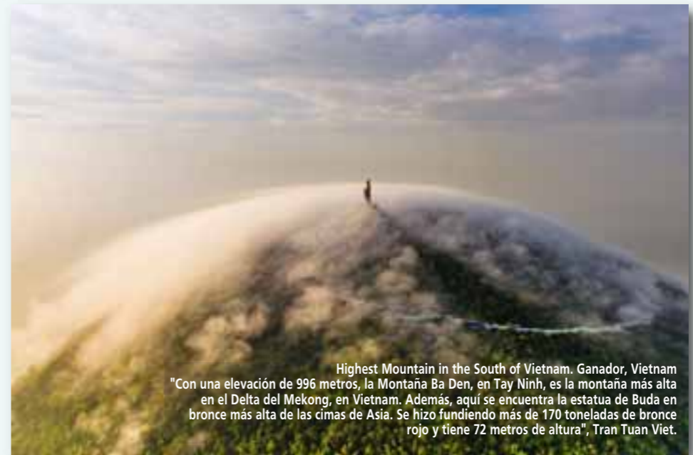
Highest Mountain in the South of Vietnam. Ganador, Vietnam "Con una elevación de 996 metros, la Montaña Ba Den, en Tay Ninh, es la montaña más alta en el Delta del Mekong, en Vietnam. Además, aquí se encuentra la estatua de Buda en bronce más alta de las cimas de Asia. Se hizo fundiendo más de 170 toneladas de bronce rojo y tiene 72 metros de altura", Tran Tuan Viet.

nadas capturan la esencia y el espíritu de cada lugar de una manera única y conmovedora. Entre las imágenes más destacadas de América Latina se encuentran aquellas que muestran la vibrante vida urbana de las ciudades, así como la riqueza de la naturaleza y la cultura de la región. Por otro lado, las fotografías ganadoras de Europa revelan la majestuosidad de sus paisajes, la historia impregnada en sus monumentos y la diversidad de su gente y sus tradiciones. Más información: www.worldphoto.org/sony-world-photography-awards/winners-galleries/2024/