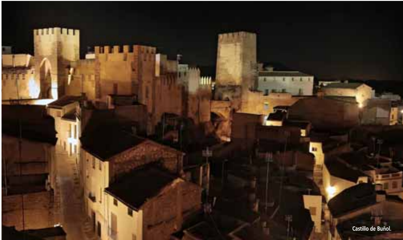
Castillo de Buñol.