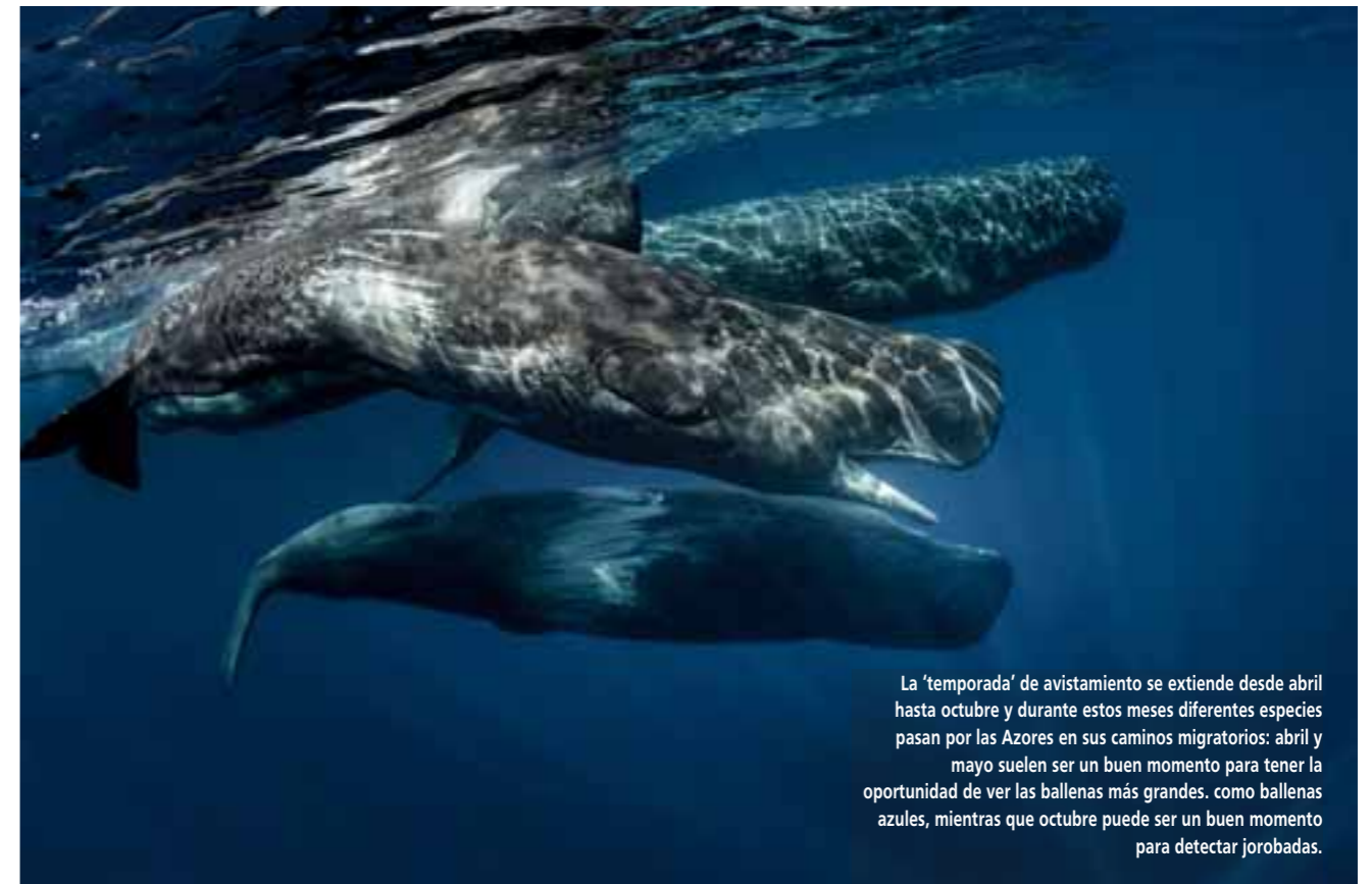
La 'temporada' de avistamiento se extiende desde abril hasta octubre y durante estos meses diferentes especies pasan por las Azores en sus caminos migratorios: abril y mayo suelen ser un buen momento para tener la oportunidad de ver las ballenas más grandes, como ballenas azules, mientras que octubre puede ser un buen momento para detectar jorobadas.

Hermanus, un encantador pueblo a solo una hora y media de Ciudad del Cabo, es reconocido como uno de los mejores destinos mundiales para el avistamiento de ballenas. Sus aguas tranquilas y su ubicación privilegiada hacen que sea un lugar ideal para presenciar el impresionante espectáculo de estos majestuosos mamíferos marinos. Durante los meses de julio a noviembre, cientos de ballenas francas australes se acercan a la bahía para el apareamiento y la cría de ballenatos. Lo más notable es que estas ballenas a menudo se acercan tanto a la costa que los visitantes pueden observarlas fácilmente desde la orilla, aunque embarcarse para una experiencia más cercana en alta mar es incomparable.