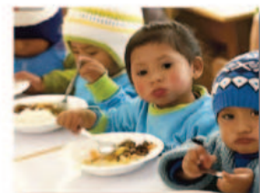
Donación Programa Mundial de Alimentos de Naciones Unidas. Premio Nobel de la Paz 2020.