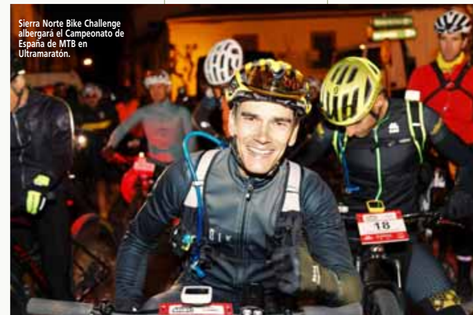
Sierra Norte Bike Challenge albergará el Campeonato de España de MTB en Ultramaratón.

El 5 de octubre de 2024 Sierra Norte Bike Challenge albergará el campeonato de España de MTB en distancia ultramaratón en Rascafría en la Sierra Norte de Madrid. La 9ª edición de la Sierra Norte Bike Challenge (SNBC) acogerá la prueba de referencia a nivel nacional para los bikers de larga distancia del País. La prueba consta de un total de 213 Kms y un desnivel positivo de 4.607 mts, un auténtico reto y aventura en el centro de España. El recorrido de la prueba se desarrolla en el anillo ciclista de la Sierra Norte, Ciclamadrid MTB Tour que atraviesa 28 municipios de la espectacular Sierra Norte de Madrid. La prueba cuenta con 5 puntos de avituallamientos en el recorrido circular que empieza y acaba en la plaza del municipio de Rascafría. El campeonato de España de