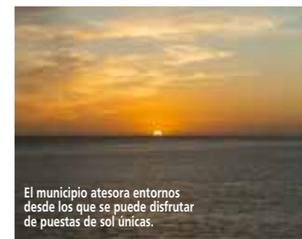
El municipio atesora entornos desde los que se puede disfrutar de puestas de sol únicas.

Teide y viajes interinsulares. Además, Arona dispone de carretera directa hacia El Teide y del único puerto que une por mar a Tenerife con las islas de La Gomera, El Hierro y La Palma. Y, por si fuera poco, está cerca del aeropuerto internacional Reina Sofía, que conecta con las islas, con la Península y con numerosos países.