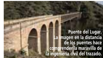
Puente del Lugar. La imagen en la distancia de los puentes hace comprender la maravilla de la ingeniería civil del trazado.