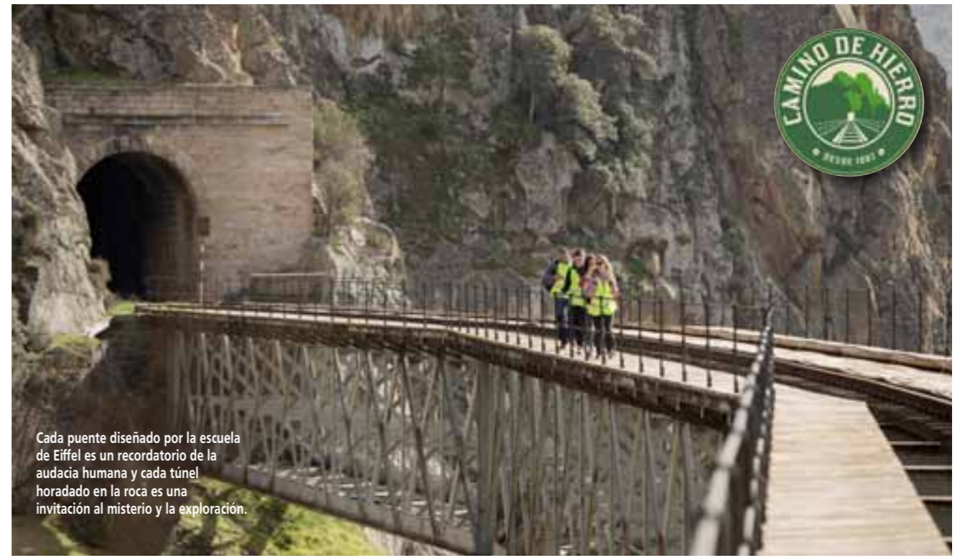
Cada puente diseñado por la escuela de Eiffel es un recordatorio de la audacia humana y cada túnel horadado en la roca es una invitación al misterio y la exploración.

La duración aproximada para realizar esta excursión es de unas seis horas. Para adecuar la antigua vía férrea como sendero turístico y hacer la ruta transitable y segura se han añadido señalizaciones e instalaciones como zonas de descanso o baños. Se precisa adquirir una entrada a través de la página web del proyecto. El precio incluye un seguro para las personas que cubren la ruta y la opción del autobús lanzadera para devolver a los senderistas al punto de partida. Igualmente, hay que respetar unos horarios de tránsito.