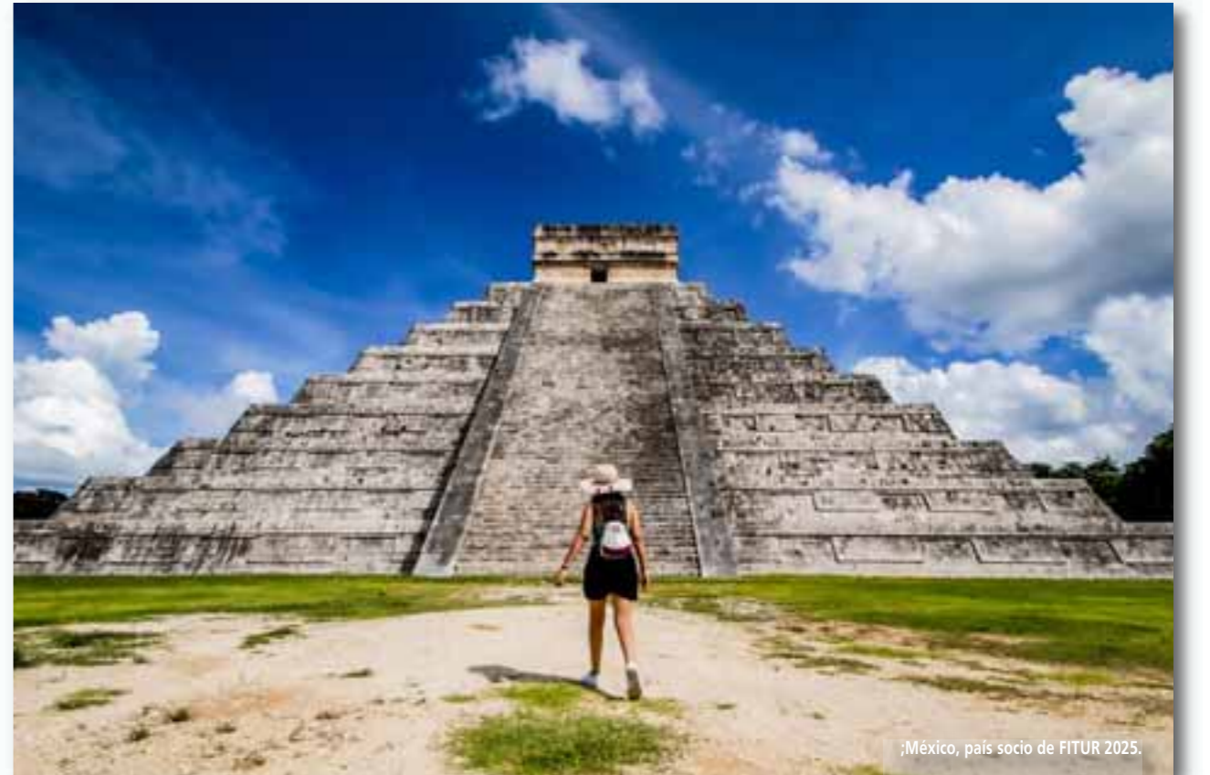
México, país socio de FITUR 2025.

tido durante sus dos jornadas abiertas al público (sábado 27 y domingo 28). Estas cifras, en línea con la estimación realizada por IFEMA MADRID, suponen un incremento del 13,7% respecto al 2023. FITUR 2024 ha destacado también por batir récord de superficie de exposición, con un total de nueve pabellones, uno más que en 2023, así como por la consolidación de su influencia global con 152 países y 96 participaciones oficiales de países.