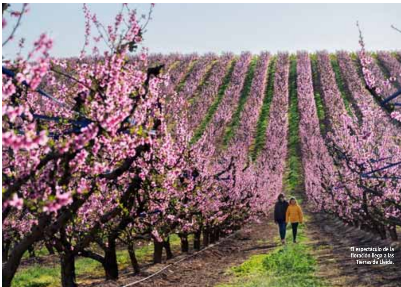
El espectáculo de la floración llega a las Tierras de Lleida.