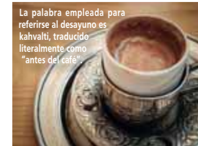
La palabra empleada para referirse al desayuno es kahvaltı, traducido literalmente como "antes del café".

El método de preparación del café turco ha permanecido inalterado durante siglos, y ésta es una de las razones de su singularidad. El café turco se prepara infundiendo granos de café molidos y pulverizados en agua fría en un recipiente llamado "Cevze". Después