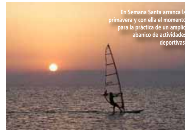
En Semana Santa arranca la primavera y con ella el momento para la práctica de un amplio abanico de actividades deportivas.

dos y ferias, los artesanos exhiben sus habilidades en la creación de piezas únicas, desde cerámicas y textiles hasta joyería y productos de cuero, ofreciendo a los visitantes la oportunidad de llevarse consigo un pedazo de la cultura local. Además, la llegada de la primavera trae consigo un clima cálido y soleado que invita a disfrutar de la naturaleza en todo su esplendor. Los parques naturales, jardines