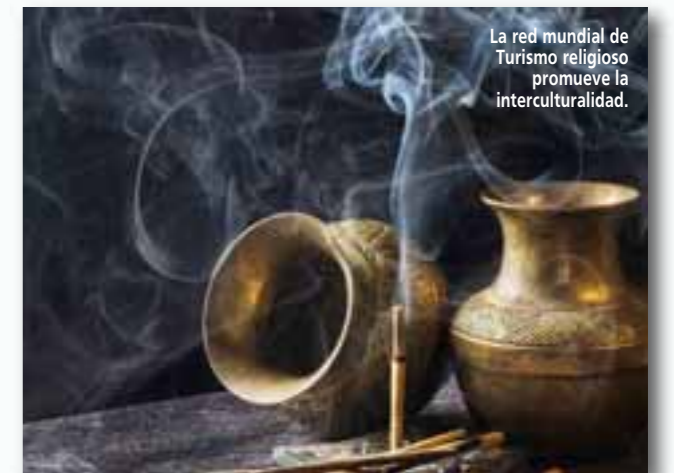
La red mundial de Turismo religioso promueve la interculturalidad.

www.tourismandsocietytt.com/red-mundial-turismo-religioso