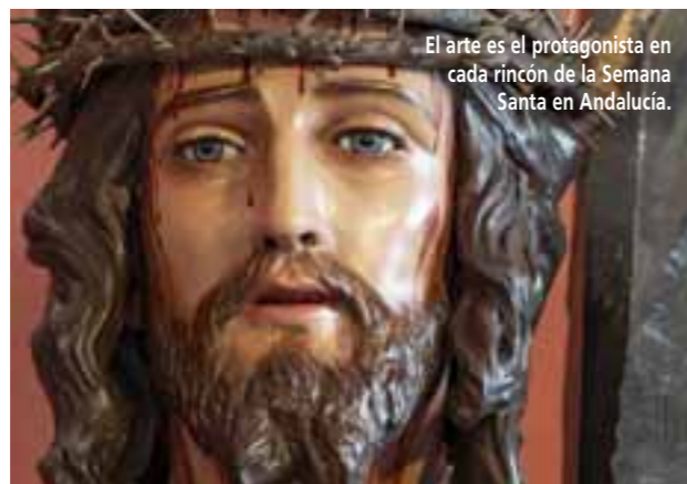
El arte es el protagonista en cada rincón de la Semana Santa en Andalucía.

En Jerez de la Frontera, la Semana Santa tiene un carácter más íntimo y familiar, pero no menos emocionante. La ciudad, conocida como la "Semana Santa Chiquita", se llena de procesiones tradicionales y fervorosas. La procesión del Cristo de la Expiración y la Virgen de la Soledad son dos de las más destacadas, con miles de fieles que llenan las calles para mostrar su devoción.