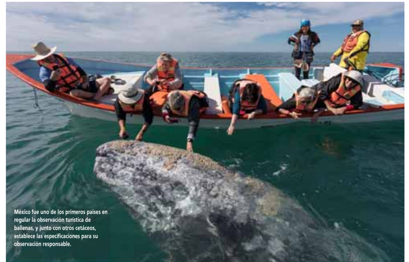
México fue uno de los primeros países en regular la observación turística de ballenas, y junto con otros cetáceos, establece las especificaciones para su observación responsable.

Pero la experiencia de avistar ballenas en el Banco de la Plata va más allá de la simple observación desde la cubierta de un barco. Uno de los mayores atractivos de viajar a este lugar es la emocionante oportunidad de hacer snorkel junto a estas majestuosas criaturas marinas. Sumergirse en las aguas turquesas y encontrarse cara a cara con las ballenas jorobadas en su hábitat natural es una experiencia que seguramente quedará grabada en la memoria de cualquier visitante.