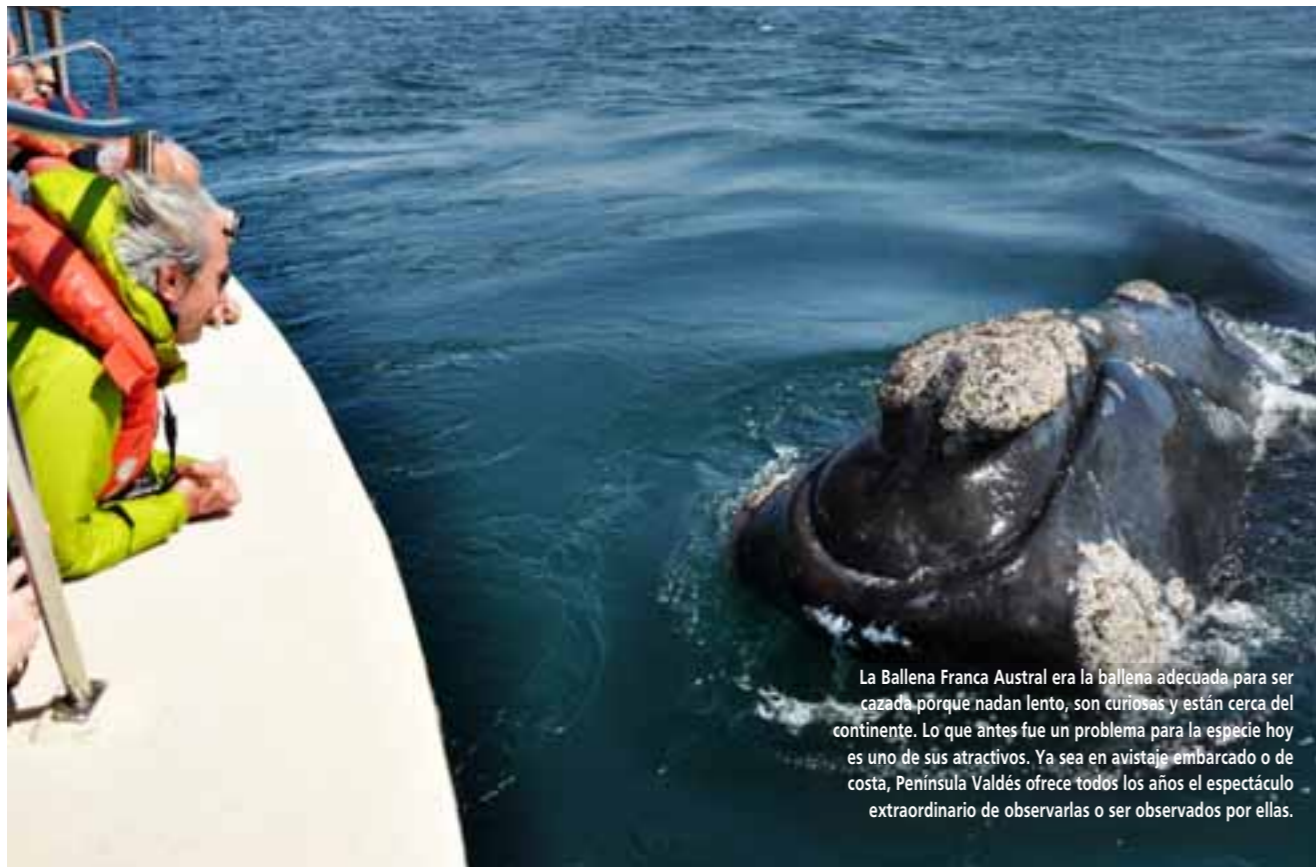
La Ballena Franca Austral era la ballena adecuada para ser cazada porque nadan lento, son curiosas y están cerca del continente. Lo que antes fue un problema para la especie hoy es uno de sus atractivos. Ya sea en avistaje embarcado o de costa, Península Valdés ofrece todos los años el espectáculo extraordinario de observarlas o ser observados por ellas.