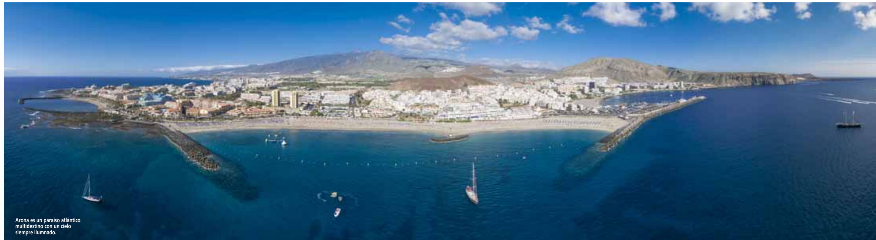
Arona es un paraíso atlántico multidestino con un cielo siempre iluminado.

Por eso, junto con su seguridad y amabilidad, millones de turistas la han escogido para sus vacaciones durante décadas y, además, suelen volver. Una de las sorpresas que a menudo les hace repetir, es descubrir que Arona es un buen clima, playa y mucho más.