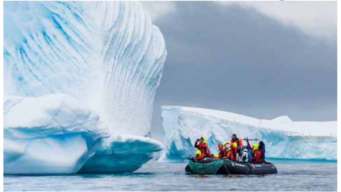
Crucero por Andalucía.

Te ofrecemos alojamiento en tiendas premium seleccionadas cuidadosamente, hechas de lona. Cada tienda tiene ventanas, un suelo de madera, una puerta amplia que se abre a la naturaleza circundante, una terraza de ma-