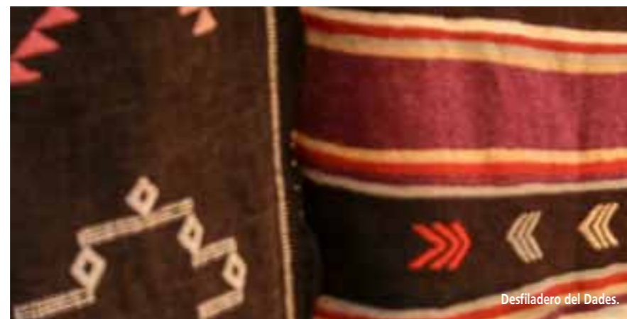
Desfiladero del Dades.

En pareja o en solitario, el desierto de Zagora es un "must do & see" en Marruecos! En 4x4 o en Buggy, es perfecto para escapadas, para caminatas de 2 o 3 días y para experiencias auténticas.