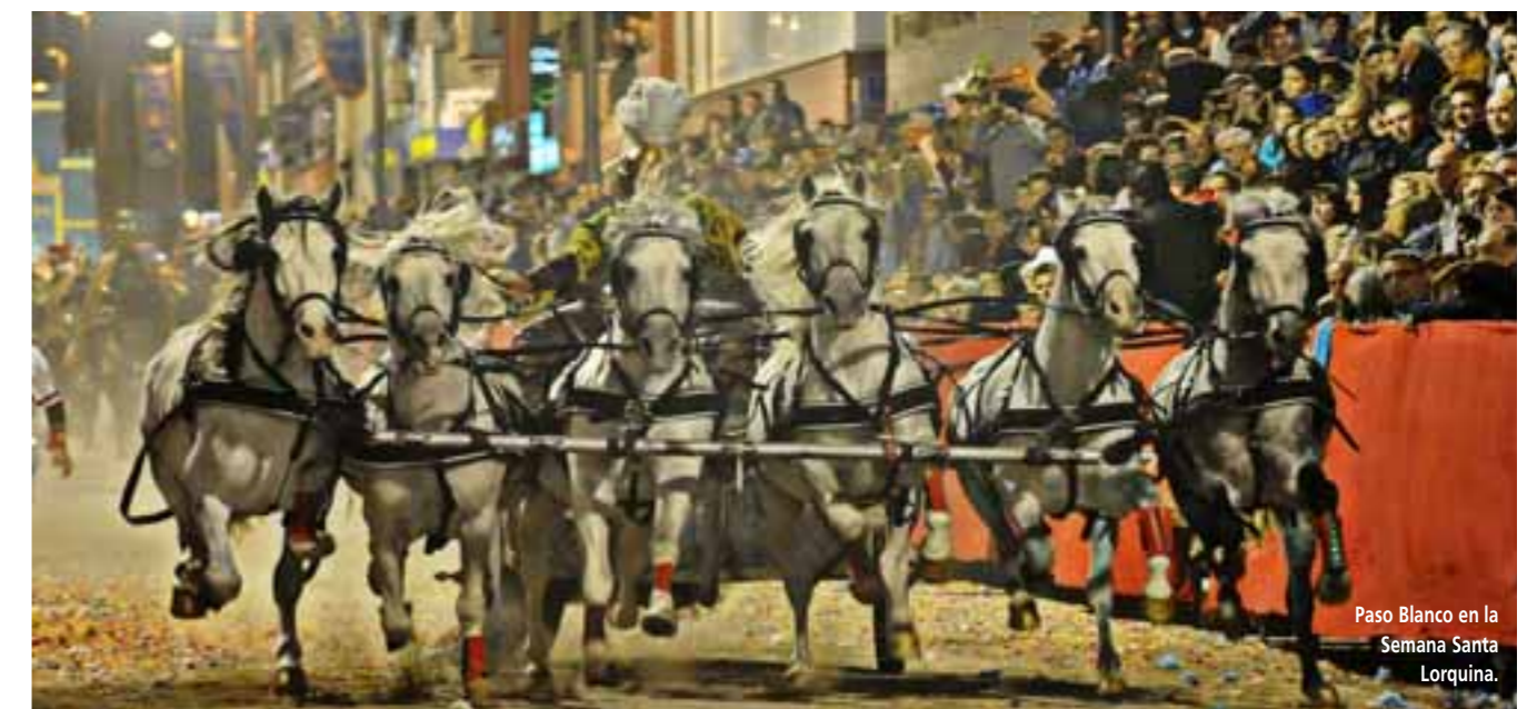
Paso Blanco en la Semana Santa Lorquina.

Toda la información sobre estas actividades y alojamientos puede ser consultada y actualizada a través de la agenda en www.lorcaturismo.es o bien informándose en la Oficina Municipal de Turismo ( lorcaturismo@lorca.es , tel. 968 44 19 14)