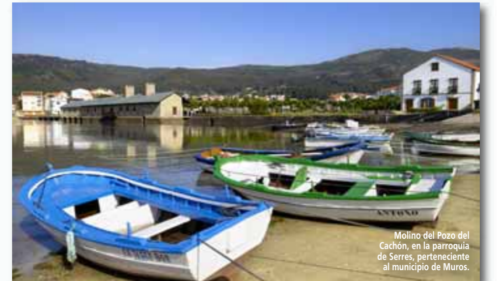
Molino del Pozo del Cachón, en la parroquia de Serres, perteneciente al municipio de Muros.

que acudían por mar, la Ría presume de conservar su genuina esencia, alejada de masificación y ajetreos. Fiel a su historia, en la que los habitantes se ven reflejados, no hay un rincón, cascada, orilla del río, iglesia, pazo, mirador o playa que no guarde un secreto o encierre una historia que no merezca la pena ser descubierta. Más información: www.riadaestrela.com