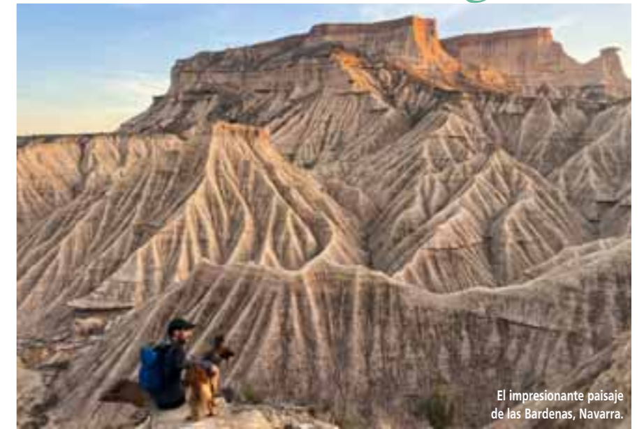
El impresionante paisaje de las Bardenas, Navarra.

Sin embargo, cuadrigas, sigas y otros engan-