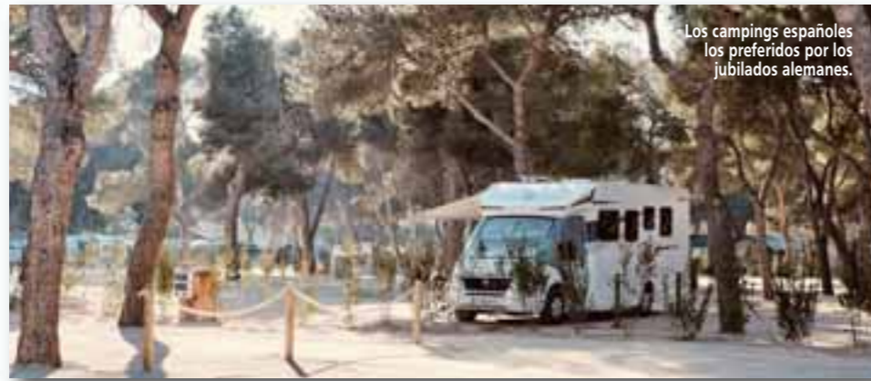
Los campings españoles los preferidos por los jubilados alemanes.

El Forfait Plus+ es un forfait de carácter personal y que funciona con un sistema de pago por uso. Una de las principales ventajas de este forfait es que permite acceder a cualquiera de las estaciones con un 15% de descuento sobre el precio de taquilla a partir del segundo día de esquí en una misma estación, por lo que es uno de los forfaits más utilizados por los clientes de Grandvalira Resorts que desean disfrutar de las diferentes estaciones andorranas según sus