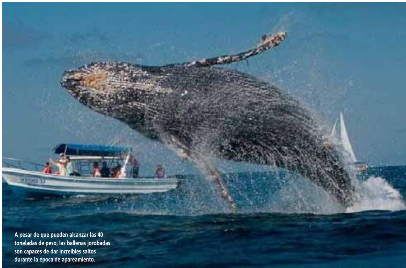
A pesar de que pueden alcanzar las 40 toneladas de peso, las ballenas jorobadas son capaces de dar increíbles saltos durante la época de apareamiento.