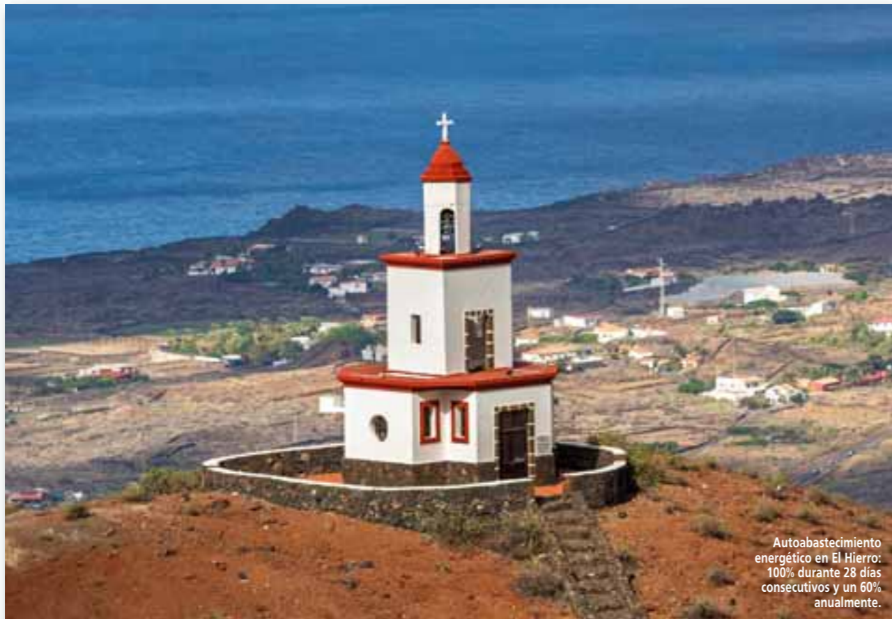
Autoabastecimiento energético en El Hierro: 100% durante 28 días consecutivos y un 60% anualmente.

macho más joven y otro mayor. Tuvo que esperar hasta ocho horas para captar la conmovedora escena que ha conquistado a los amantes de los animales y de la fotografía.