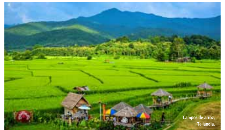
Campos de arroz, Tailandia.

Visitar el Museo Nacional de Nan Aunque los museos no sean lo tuyo, el Museo Nacional de Nan merece una visita. Convenientemente situado en el centro de la ciudad de Nan, a un corto paseo de Wat Phumin, este fotogénico museo fue la antigua residencia de un noble de Nan antes de servir como ayuntamiento y ahora como museo. El pintoresco recinto es razón suficiente para visitarlo, pero no dejes de visitarlo por dentro y aprender más sobre la fascinante historia de Nan y sus habitantes. El recinto alberga también el templo más pequeño de Tailandia, Wat Noy. A primera vista, la diminuta estructura parece una casa de espíritus, pero en realidad es un templo. Admirar los murales de Wat Phumin De todas las atracciones de la ciudad de Nan, Wat Phumin es la más famosa entre los visitantes tailandeses. El templo real fue construido por un antiguo gobernante de Nan en el siglo XVI. Wat Phumin fue renovado a mediados y finales del siglo XIX, época en la que un artista local de Tai Lue pintó los famosos murales del templo. Los murales no solo representan escenas