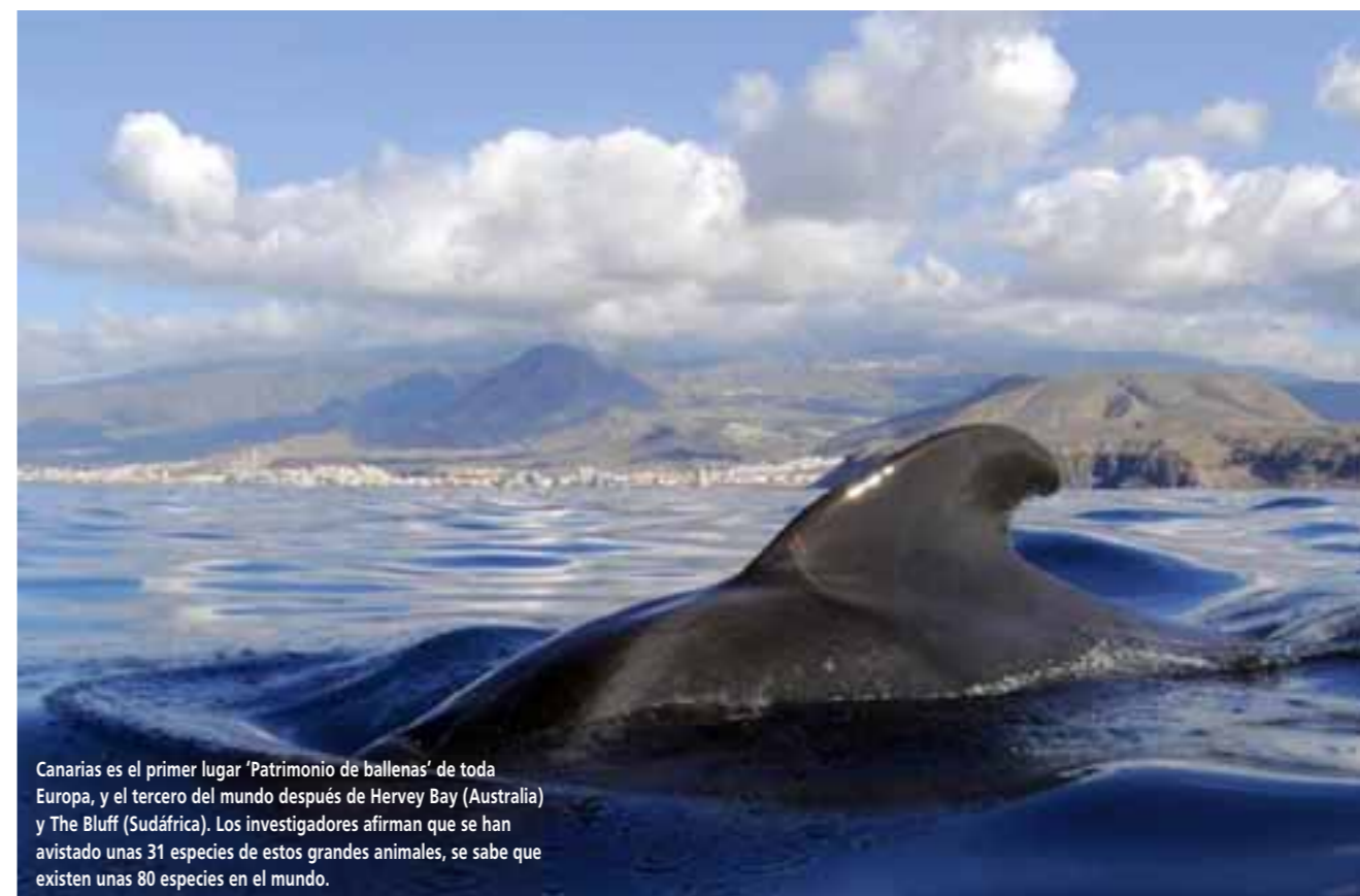
Canarias es el primer lugar 'Patrimonio de ballenas' de toda Europa, y el tercero del mundo después de Hervey Bay (Australia) y The Bluff (Sudáfrica). Los investigadores afirman que se han avistado unas 31 especies de estos grandes animales, se sabe que existen unas 80 especies en el mundo.

Cada primavera, las ballenas grises migran a través de las aguas de Alaska en su camino hacia sus zonas de alimentación de verano en los mares de Bering y Chukchi, unas 20.000 ballenas grises se desplazan a lo largo de la costa exterior del sudeste de Alaska, a finales de marzo, todo el mes de abril y hasta bien entrado mayo. A medida que avanza el verano, las observaciones frecuentes de ballenas jorobadas, Minke y orcas, están presentes en las aguas de la costa de Alaska, en las numerosas bahías de Kodiak y en el Glacier Bay, también en el interior del paso alrededor de Juneau.