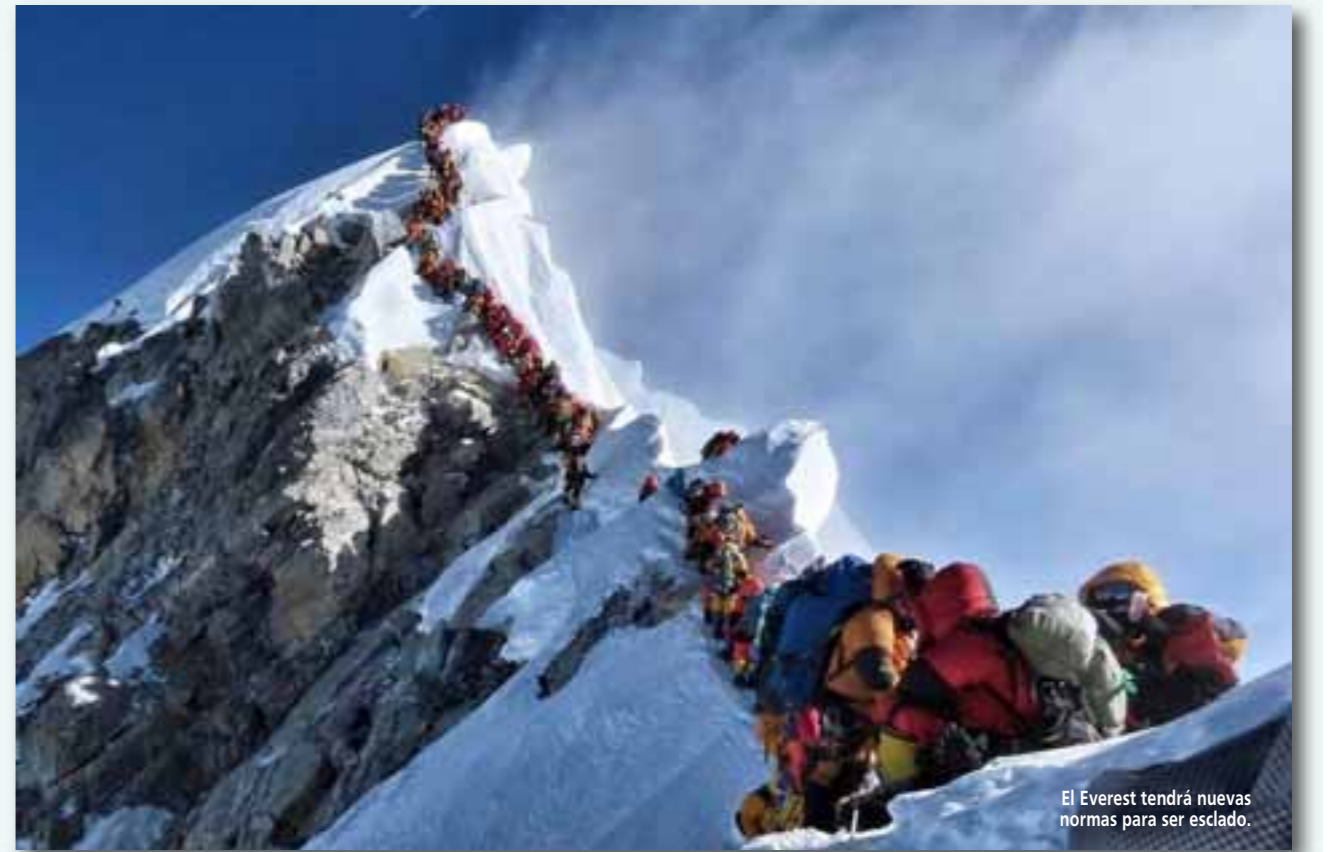
El Everest tendrá nuevas normas para ser escalado.

La Organización Mundial de Fotografía ha anunciado a los galardonados de los Premios Nacionales y Regionales en el prestigioso certamen