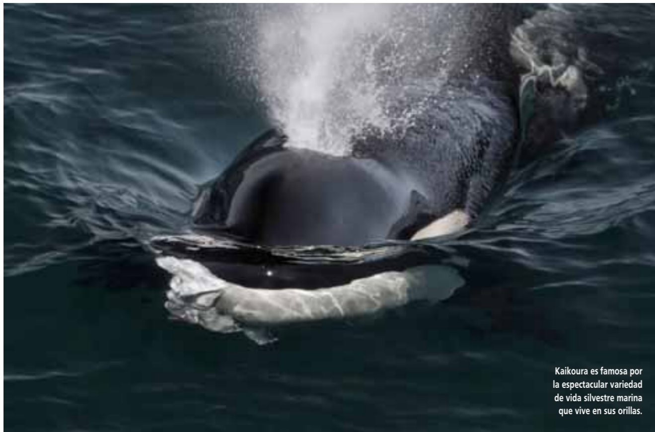
Kaikoura es famosa por la espectacular variedad de vida silvestre marina que vive en sus orillas.

LOS MEJORES DESTINOS PARA AVISTAMIENTO DE BALLENAS