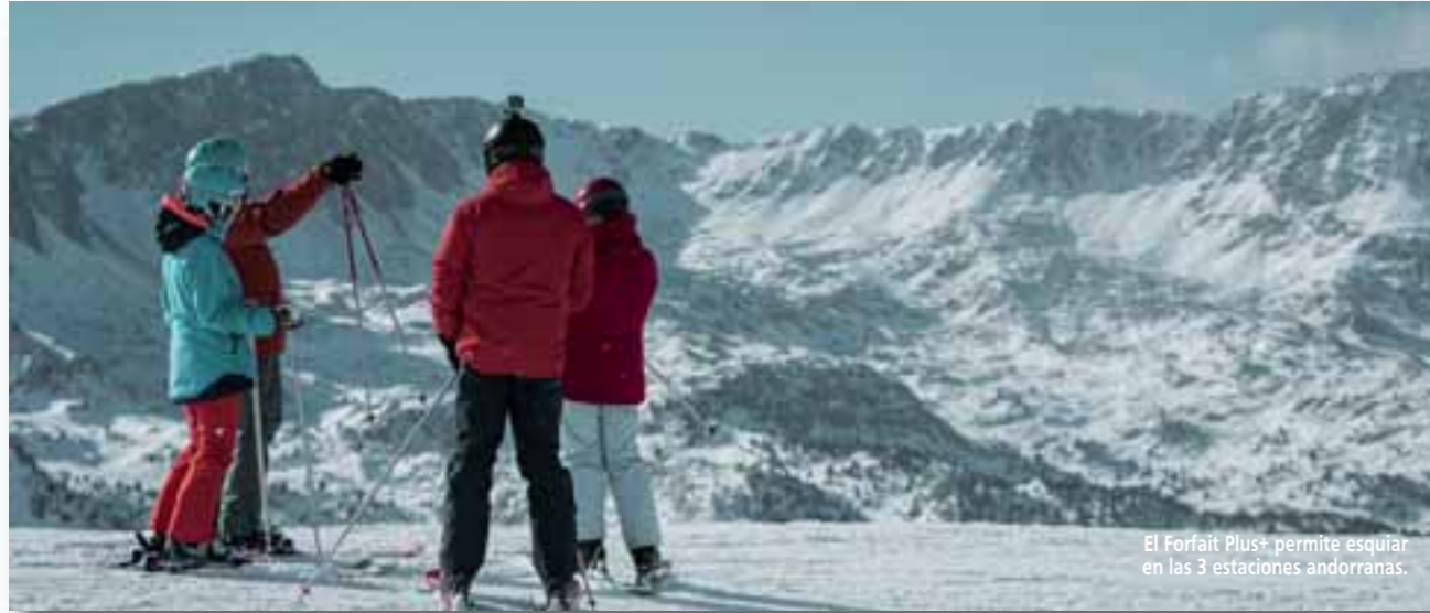
El Forfait Plus+ permite esquiar en las 3 estaciones andorranas.