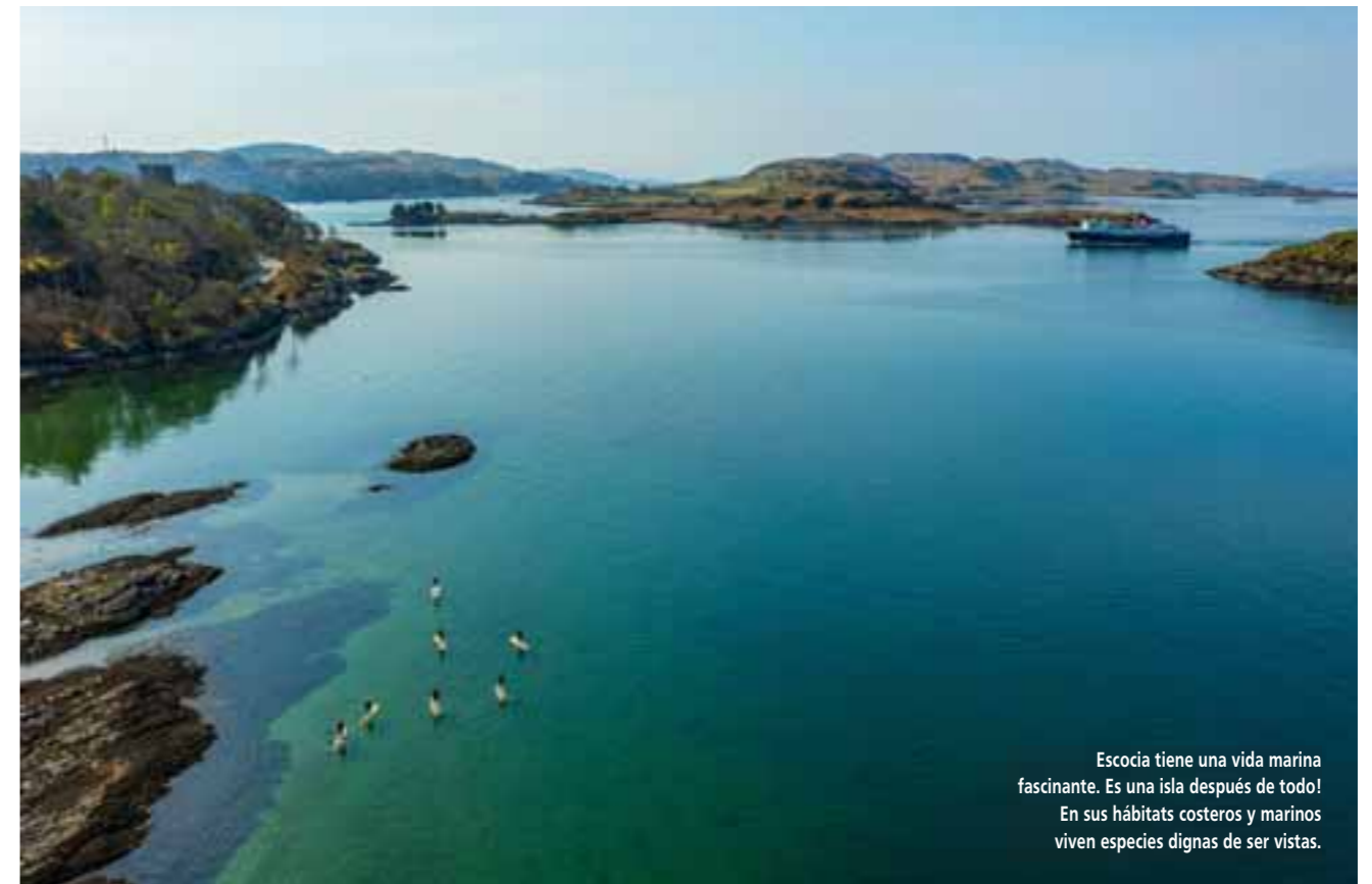
Escocia tiene una vida marina fascinante. Es una isla después de todo! En sus hábitats costeros y marinos viven especies dignas de ser vistas.

En este caso, las dueñas del show son ballenas azules, los animales más grandes sobre la faz de la Tierra, que pueden ser observadas desde unos pocos metros de distancia.