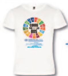
Camiseta de algodón orgánico

8.000.000.000 de segundos de actividad deportiva, un segundo por cada habitante del planeta