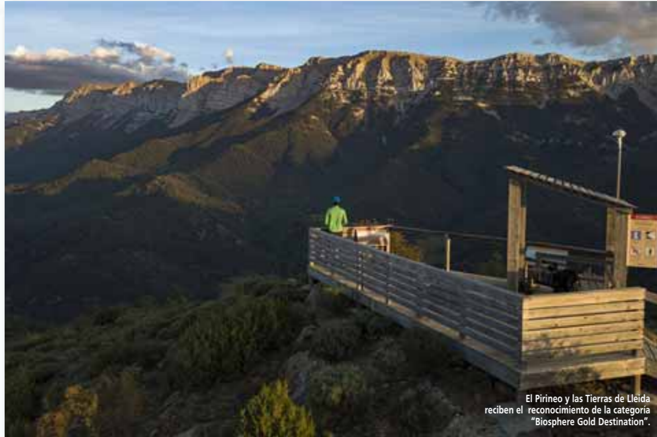
El Pirineo y las Tierras de Lleida reciben el reconocimiento de la categoría "Biosphere Gold Destination".