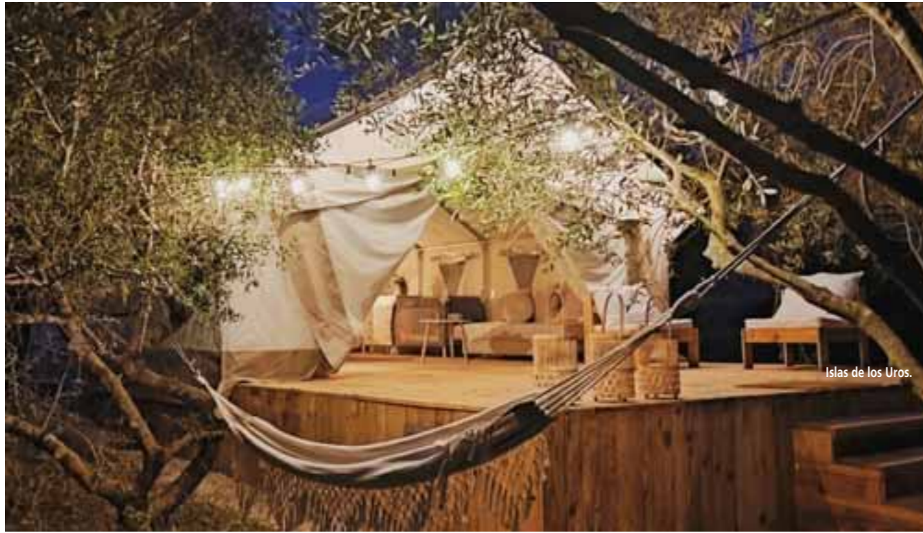
Islas de los Uros.

ción de 860m. A pesar de la exigente subida inicial, las impresionantes vistas de los Pirineos y los paisajes rurales hacen que el esfuerzo valga la pena. La llegada a Saint Jean Pied de Port, un pueblo encantador cerca de la frontera española, ofrece la oportunidad de sumergirse en su ambiente mágico y, dependiendo del día de la semana, disfrutar de su bullicioso mercado ambulante.