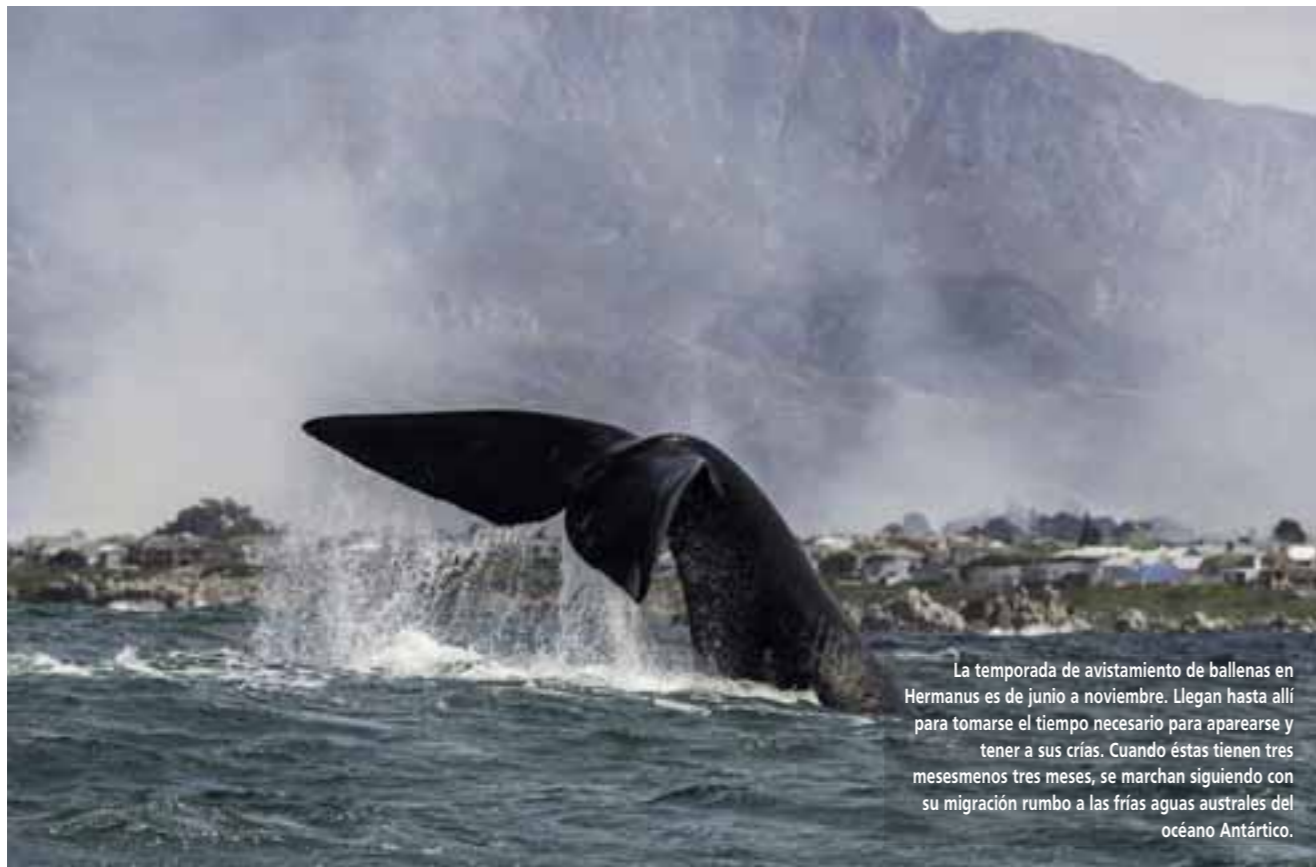
La temporada de avistamiento de ballenas en Hermanus es de junio a noviembre. Llegan hasta allí para tomarse el tiempo necesario para aparearse y tener a sus crías. Cuando éstas tienen tres meses menos tres meses, se marchan siguiendo con su migración rumbo a las frías aguas australes del océano Antártico.