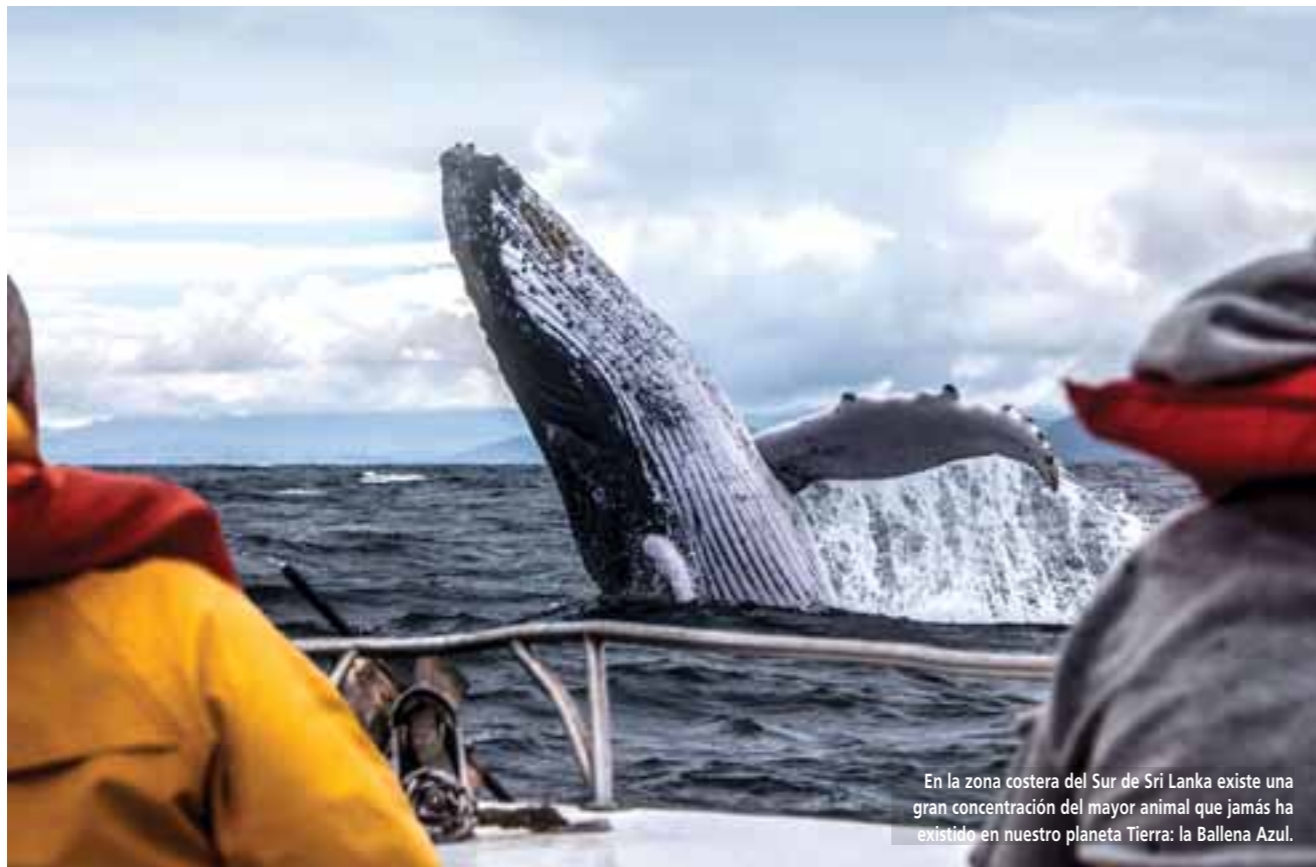
En la zona costera del Sur de Sri Lanka existe una gran concentración del mayor animal que jamás ha existido en nuestro planeta Tierra: la Ballena Azul.