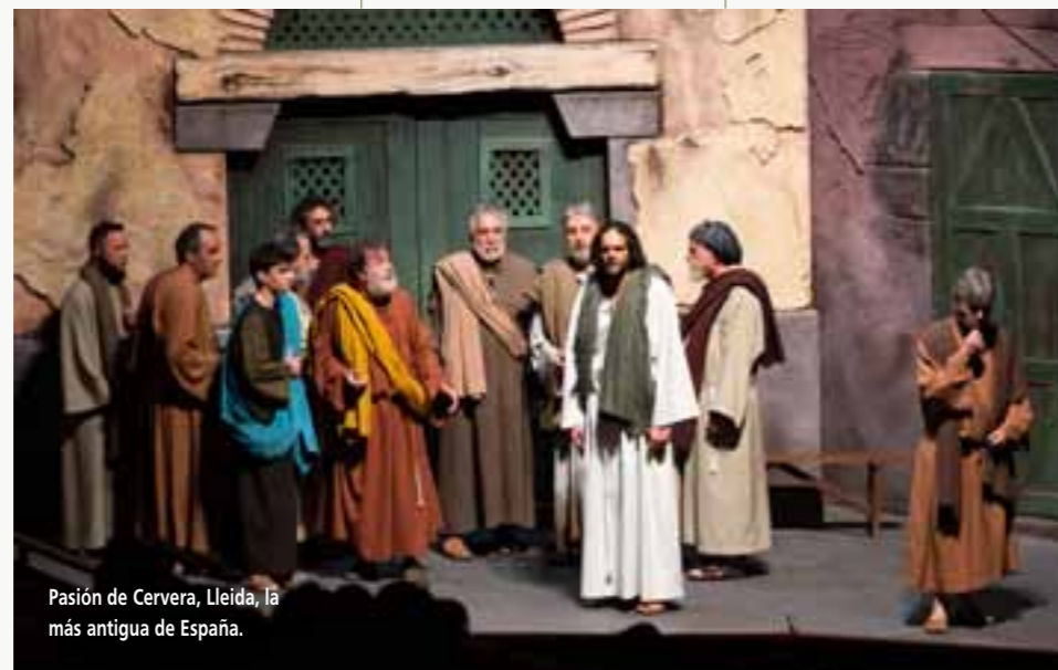
Pasión de Cervera, Lleida, la más antigua de España.

Las funciones del drama sacro "Cristo, Misterio de Pasión", una de las representaciones más multitudinarias y antiguas de Cataluña, tendrán lugar el 17, 23 y 29 de marzo y el 6, 13 y 20 de abril en el Gran Teatro de la Pasión de Cervera (la Segarra). Un año más, el Patronato de la Pasión de Cervera sigue con la apuesta de introducir innovaciones en esta magna representación religiosa, con la incorporación de nuevos personajes, la dinamización de la tercera parte de la obra y la