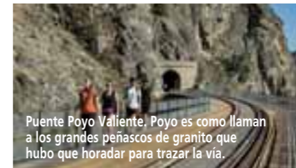
Puente Poyo Valiente, Poyo es como llaman a los grandes peñascos de granito que hubo que horadar para trazar la vía.