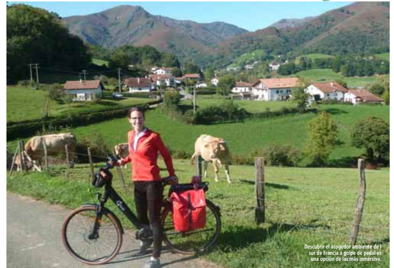
Descubrir el acogedor ambiente de la zona sur de Francia a golpe de pedal es una opción de las más inmersiva.

Mientras viaja por el árido desierto, recuerde detenerse y admirar los sitios históricos, como la Kasbah Ait Benhaddou. ¡Imposible permanecer insensible al encanto de esta maravilla, escenario de varias películas! Las fortalezas y kasbahs del Valle del Draa son igual de impresionantes: ocultan mil y una historias. Al final de su viaje, la ciudad de Zagora le dará la bienvenida para llevarle a un viaje de sensaciones y sabores. Rodeado por su palmeral y dominado por un macizo rocoso, el lugar es simplemente espléndido. Empápese de la atmósfera del lugar, dé un paseo en camello y libere su mente al atardecer. ¡No te olvides de rociar tu tarde con una noche bajo las estrellas!