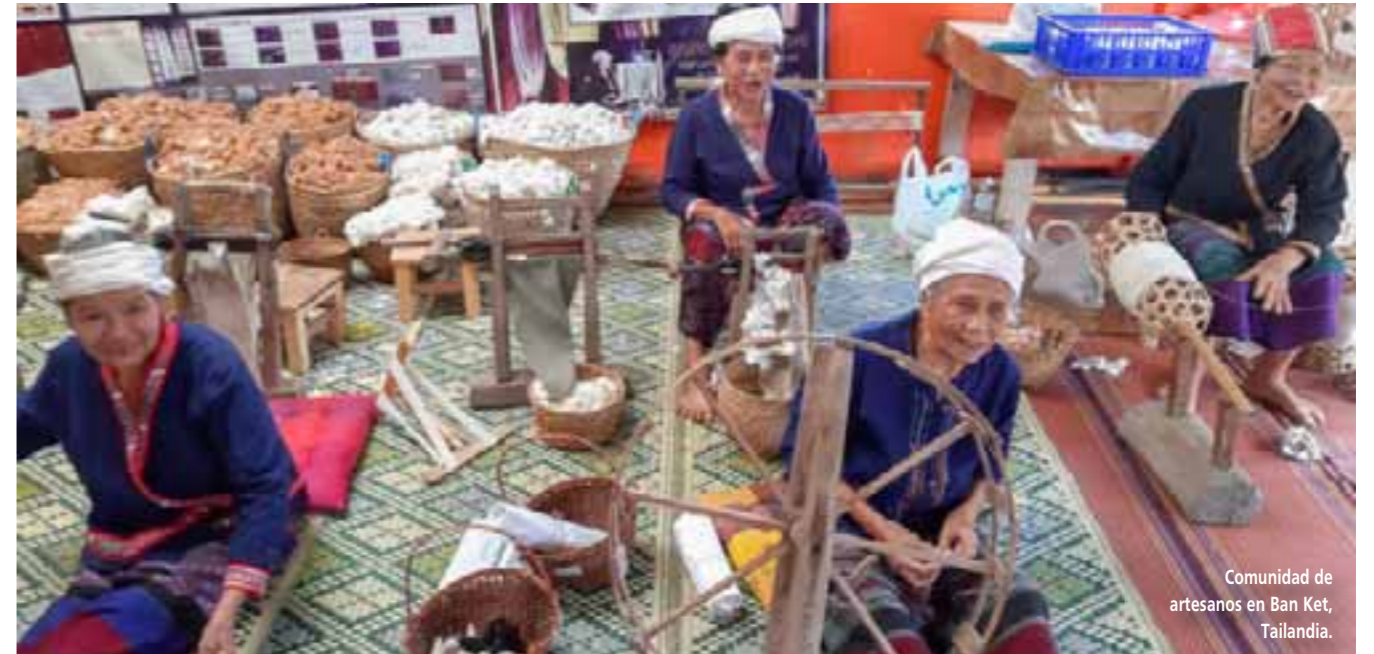
Comunidad de artesanos en Ban Ket, Tailandia.

Relax en el campo La provincia de Nan alberga algunas de los paisajes más serenos de Tailandia. Puede que sea una gran afirmación, pero si te adentras en la campiña de Nan pronto descubrirás una de las principales razones que hacen de este un destino tan especial para visitar. El ritmo de vida en la zona rural de Nan es tranquilo y, con sus montañas y arrozales como magníficos telones de fondo, es el destino ideal para relajarse. Admira las vistas en cualquiera de los Parques Nacionales de Nan, como Si Nan o Doi Khu Pha, o viaja a Pua y Sapan y descubre los beneficios de la vida en el campo. Conocer la cultura Tai Lue Se calcula que hay 83.000 miembros de la comunidad Tai Lue en Tailandia, la mayoría