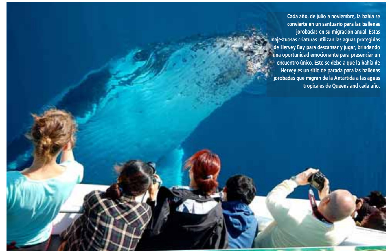
Cada año, de julio a noviembre, la bahía se convierte en un santuario para las ballenas jorobadas en su migración anual. Estas majestuosas criaturas utilizan las aguas protegidas de Hervey Bay para descansar y jugar, brindando una oportunidad emocionante para presenciar un encuentro único. Esto se debe a que la bahía de Hervey es un sitio de parada para las ballenas jorobadas que migran de la Antártida a las aguas tropicales de Queensland cada año.

El pequeño poblado de Puerto Pirámides emerge como el epicentro de esta maravillosa experiencia de avistamiento de ballenas. Ubicado en la Península Valdés, es el punto de partida ideal para embarcarse en emocionantes excursiones para observar de cerca a estos gigantes del océano. Con su singular belleza y su importancia como hábitat vital para las ballenas, esta región ofrece una oportunidad incomparable para conectarse con la naturaleza y presenciar uno de los espectáculos más impresionantes que ofrece el reino animal.