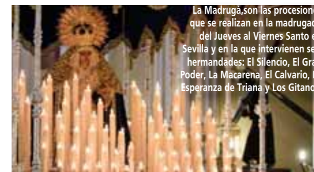
La Madrugá, son las procesiones que se realizan en la madrugada del Jueves al Viernes Santo en Sevilla y en la que intervienen seis hermandades: El Silencio, El Gran Poder, La Macarena, El Calvario, La Esperanza de Triana y Los Gitanos.

En la capital andaluza, Sevilla, la Semana Santa alcanza su apogeo con las impresionantes procesiones que recorren sus calles históricas. Cada cofradía, desde la