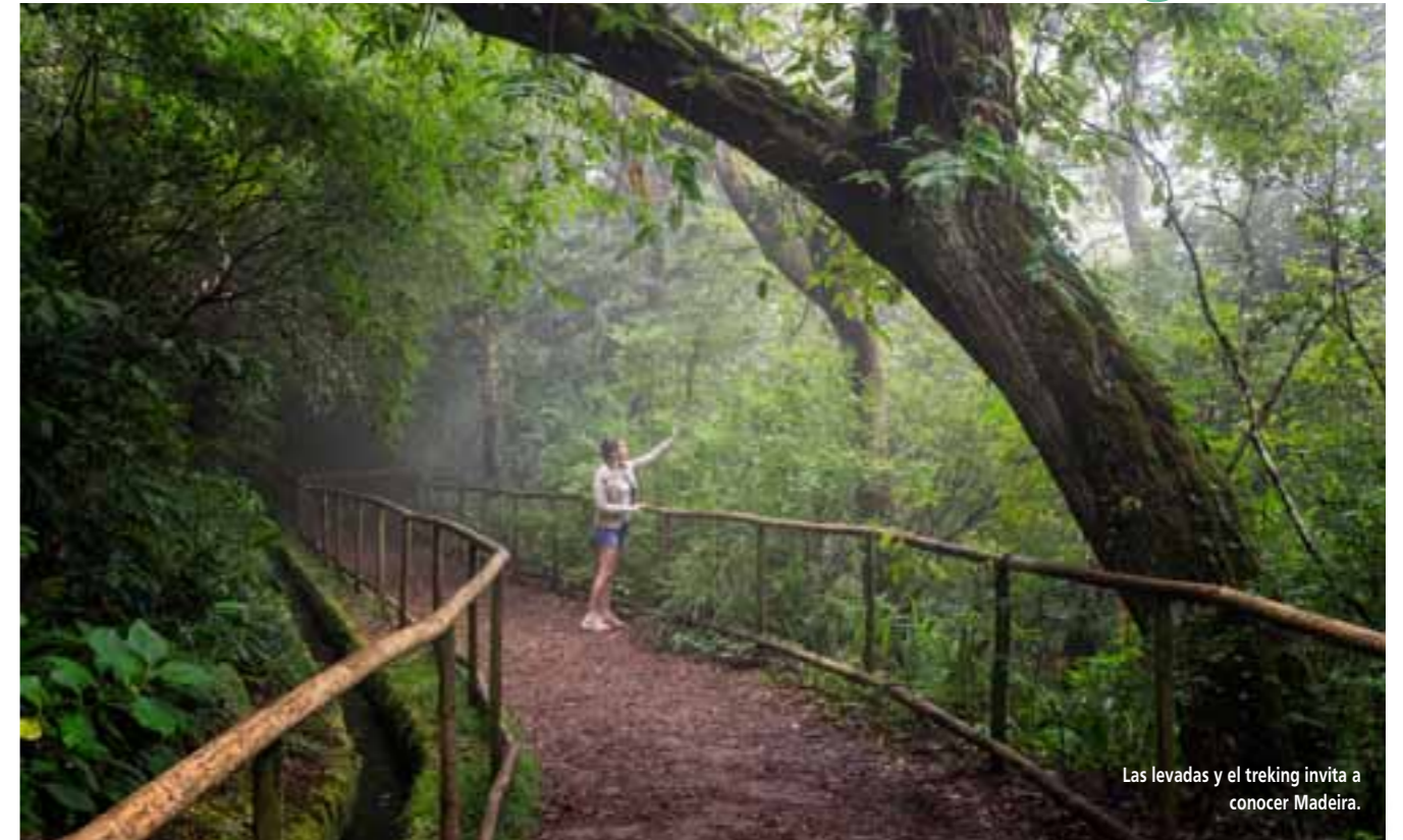
Las levadas y el trekking invita a conocer Madeira.

Madeira tiene muchas razones para ser descubierta en Semana Santa. El destino atlántico propone una serie de originales planes para disfrutarlos como se quiera en