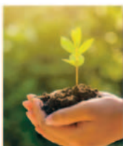
Plantar árbol en tu nombre