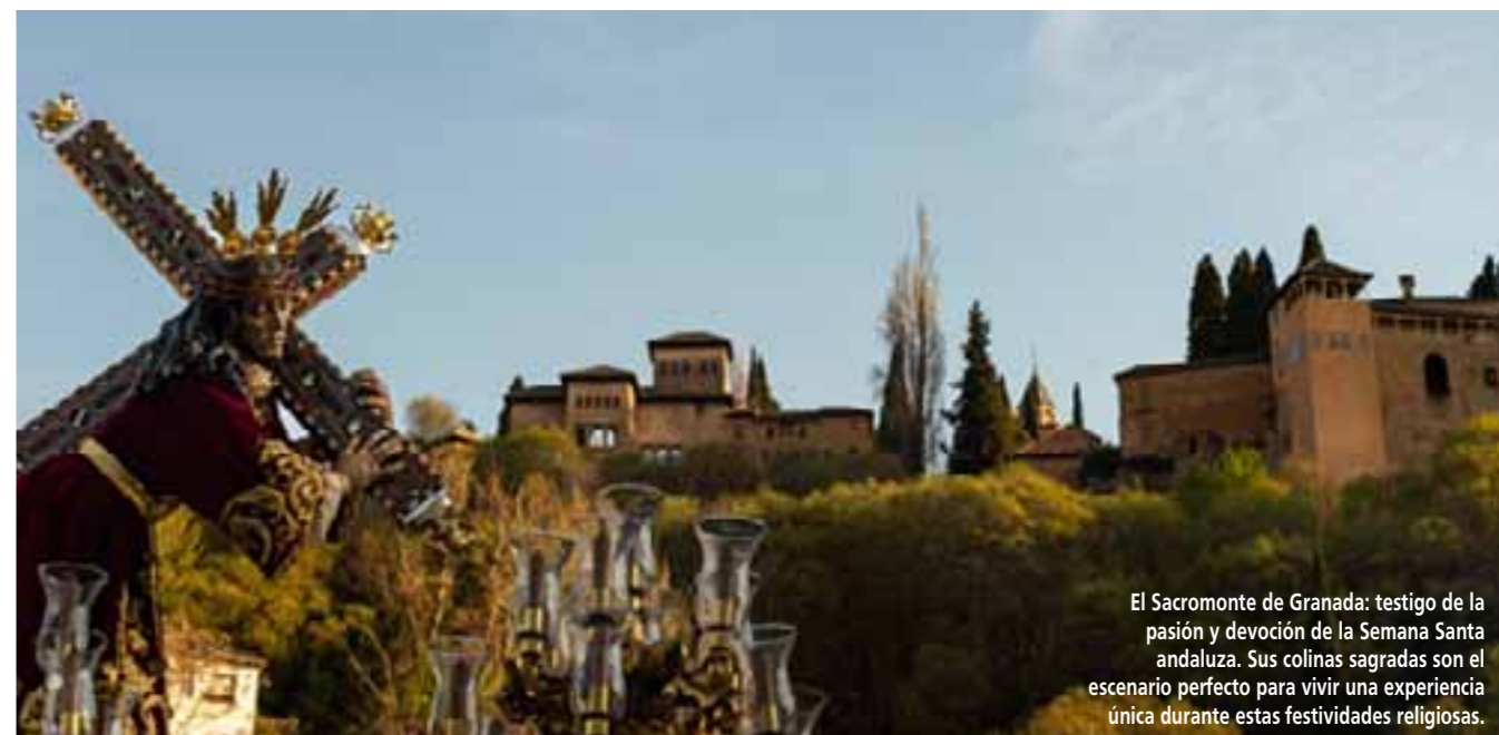
El Sacromonte de Granada: testigo de la pasión y devoción de la Semana Santa andaluza. Sus colinas sagradas son el escenario perfecto para vivir una experiencia única durante estas festividades religiosas.

hermandad del Gran Poder hasta la hermandad de la Macarena, lleva consigo siglos de tradición y fervor religioso. La madrugada del Viernes Santo, conocida como la "Madrugá", es un momento de profunda devoción, cuando las calles se llenan de fieles que acompañan en silencio el paso de las imágenes sagradas.