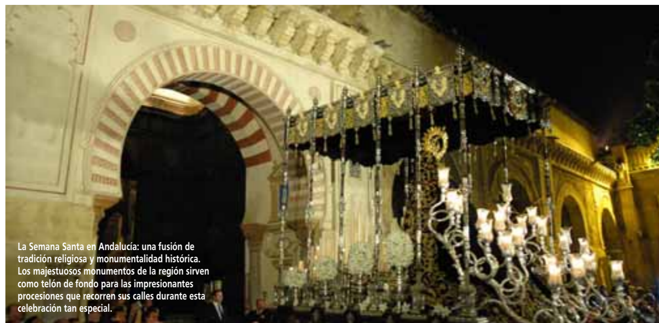
La Semana Santa en Andalucía: una fusión de tradición religiosa y monumentalidad histórica. Los majestuosos monumentos de la región sirven como telón de fondo para las impresionantes procesiones que recorren sus calles durante esta celebración tan especial.