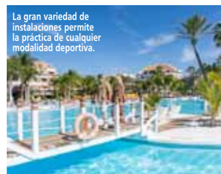
La gran variedad de instalaciones permite la práctica de cualquier modalidad deportiva.

Saborear Arona en su amplia oferta de restaurantes en costa y medianías hará que este municipio te guste aún más tentándote con platos de comida típica, multicultural, vegana e incluso de alta cocina de chefs de prestigio y con estrella Michelin. Saborear Arona, sin duda, vale la pena.