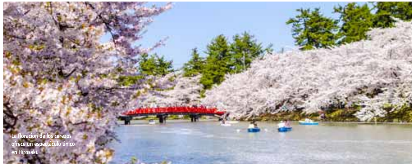
La floración de los cerezos ofrece un espectáculo único en Hirosaki.