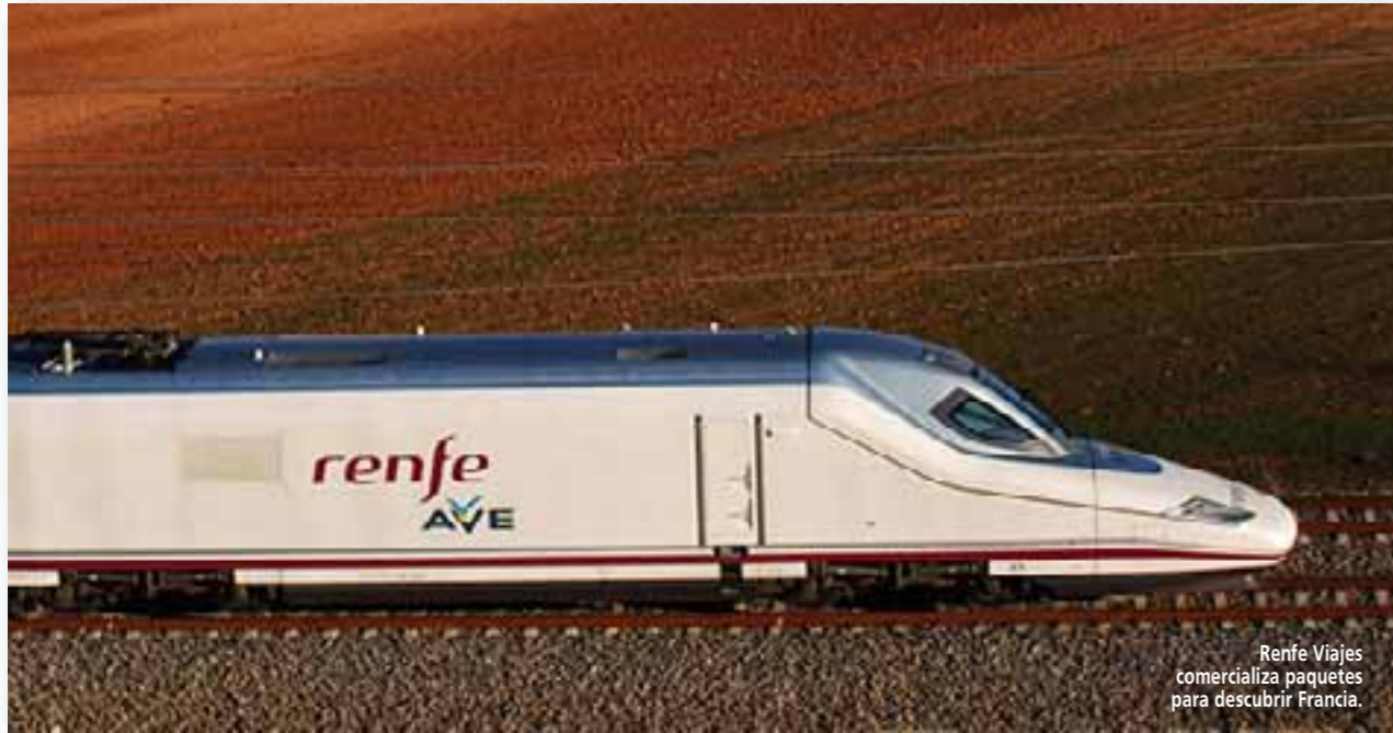
Renfe Viajes comercializa paquetes para descubrir Francia.

Viajes, la agencia comercializadora de paquetes turísticos de Renfe. La compañía ya ha integrado en su sistema de reservas para combinar tren Ave + hotel + ocio, los nueve destinos internacionales de sus trenes AVE en Francia. Al confort de viajar a Francia en AVE se suman ahora más de mil alojamientos, visitas guiadas, entradas para mu-